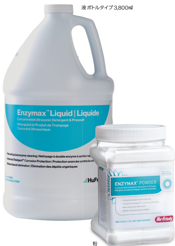
液 ボトルタイプ 3,800ml

Infection Prevention and Instrument Management